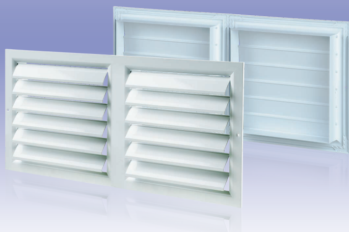
Mehrteiliges Lüftungsgitter mit selbsttätigen Verschlussklappen