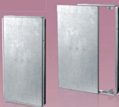
Revisionsüren mit einem PVC-Rahmen zur Befestigung einer Keramikplatte