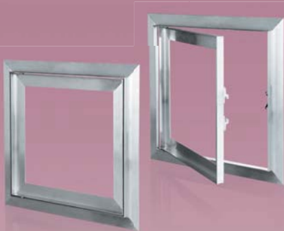
Revisions-türen zur Einbau in Gipskartonwänden