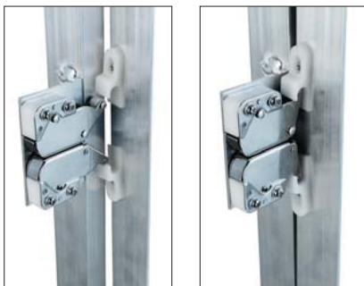
Der Sonderschluss sorgt für eine zuverlässige Fixierung