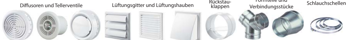
Diffusoren und Tellerventile