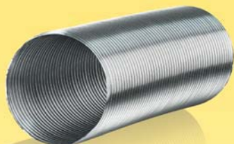
Semiflexible Luftleitungen aus Aluminium