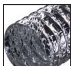
Aluminium ( )