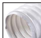
Weiß ( )