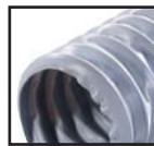
Grau ( )