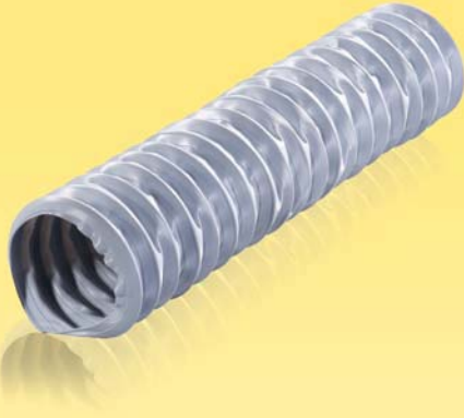
Flexible Luftleitungen aus PVC-Folie (700 µm) mit einer Federspirale.