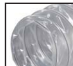
Transparent ( )