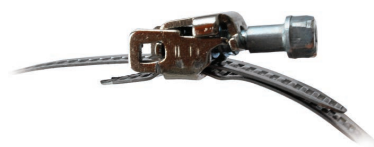
Bequeme Verriegelung für die Schlauchschellen CB und CBR