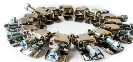
Sperrvorrichtung SU 50 für CBR 3000