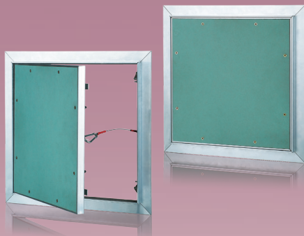
Revisionsüren zur Einbau in Gipskartonwänden