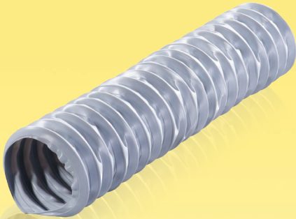
Flexible Lüftungsrohre aus PVC-Folie (700 µm) mit einer Federspirale.