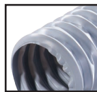
Grau ( )