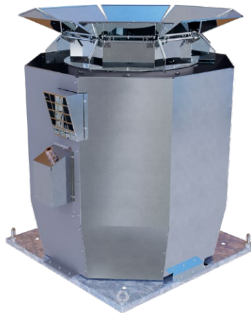
Schutzschirm ZS in geöffneter Position