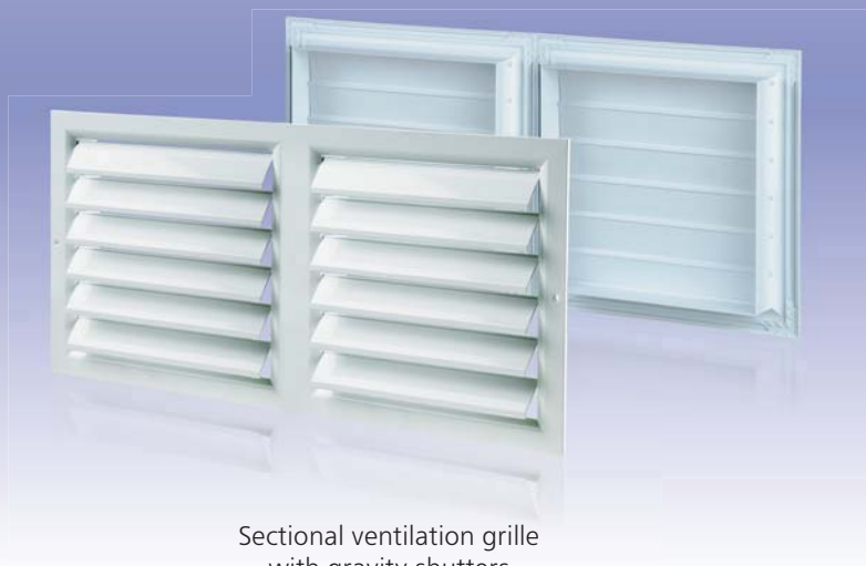
Sectional ventilation grille with gravity shutters