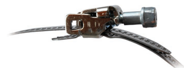
Удобный механизм замка в хомутах ХБ и ХБР