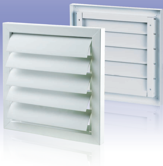
Вентиляционная решетка с гравитационными жалюзи