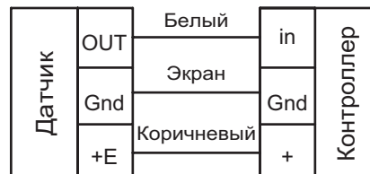
Схема электрического подключения