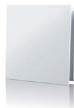
Решетка в сборе