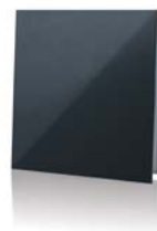
Солид Черный сапфир