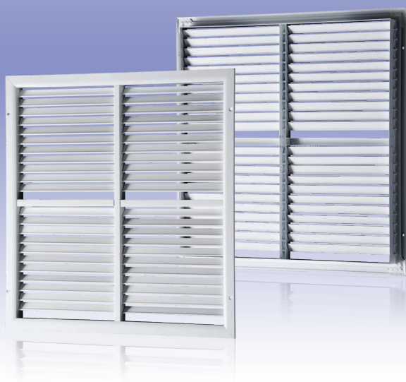
Однорядная секционная вентиляционная решетка с регулируемыми направляющими воздушного потока