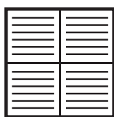
ОРК1 – параллельное расположение направляющих воздушного потока