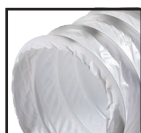
Белый ( )