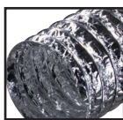
Алюминиевый ( )