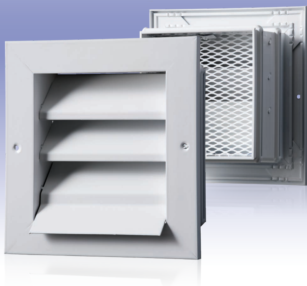
Приточно-вытяжная вентиляционная решетка с нерегулируемыми направляющими воздушного потока