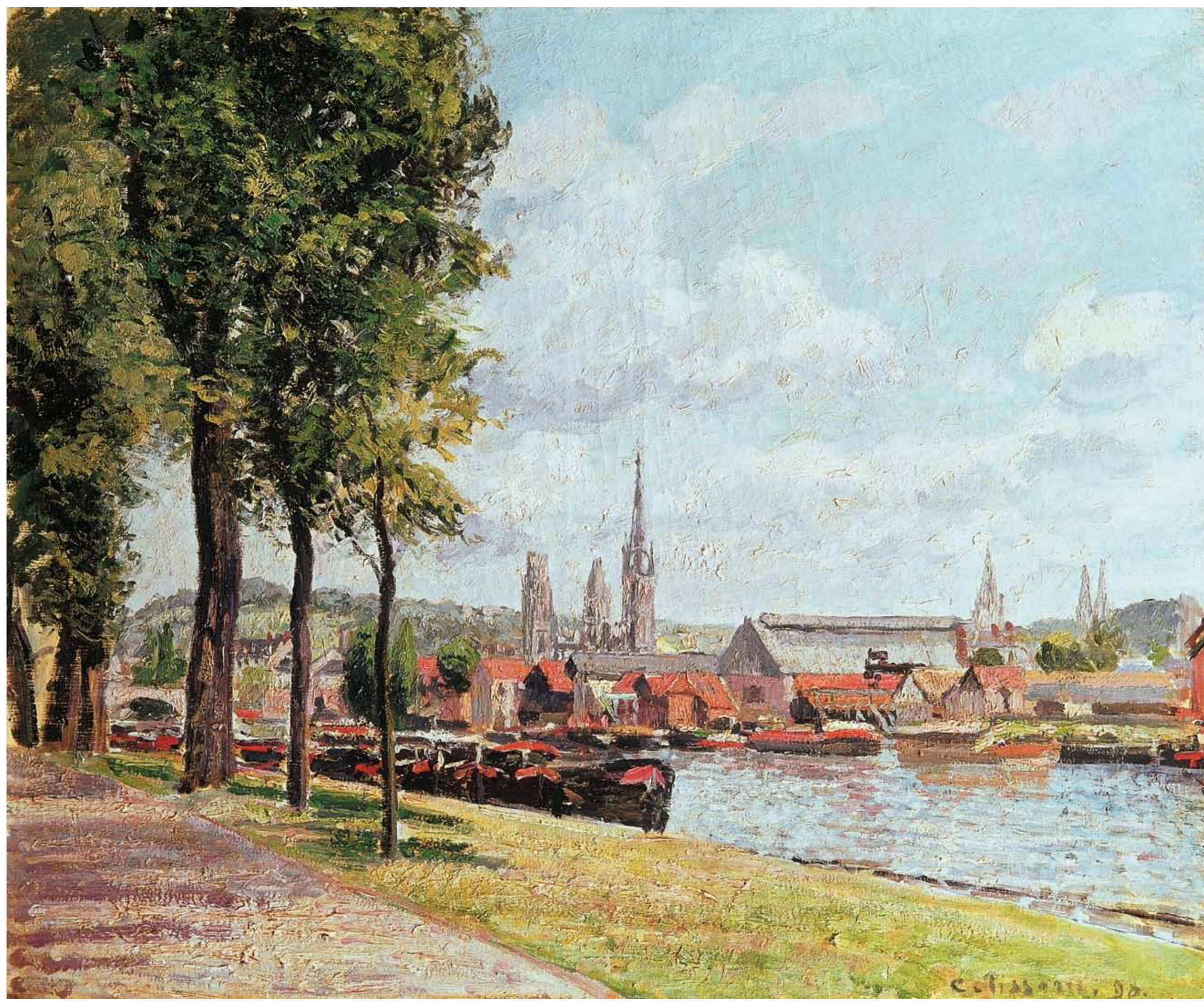
Cours La Reine, Rouen. Camille Pissarro, 1890. Кур ла Рен. Руан. Камиль Писсарро, 1890.