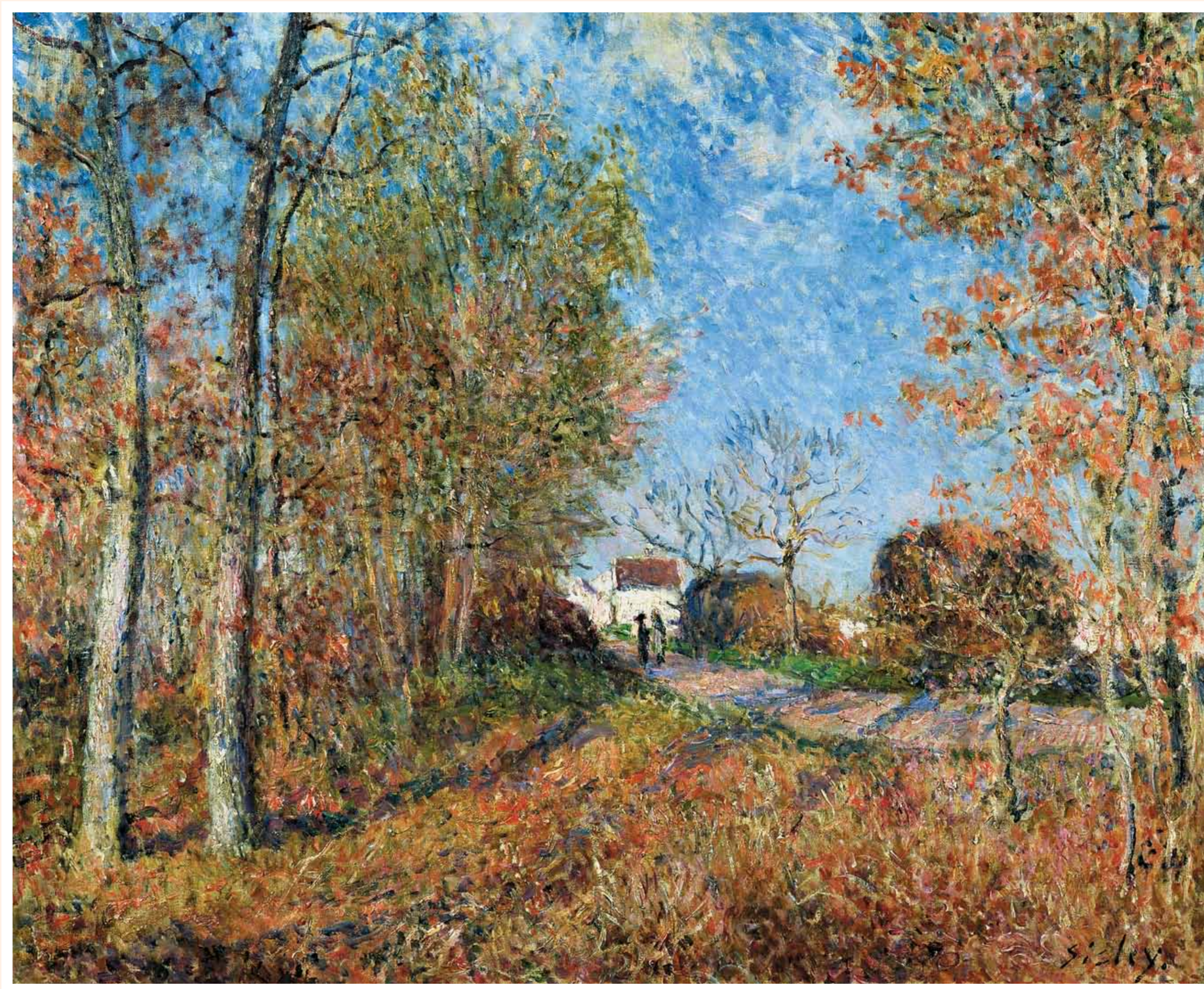
A Corner of the Woods at Sablons. Alfred Sisley, 1883. Опушка леса в Саблоне. Альфред Сислей, 1883.