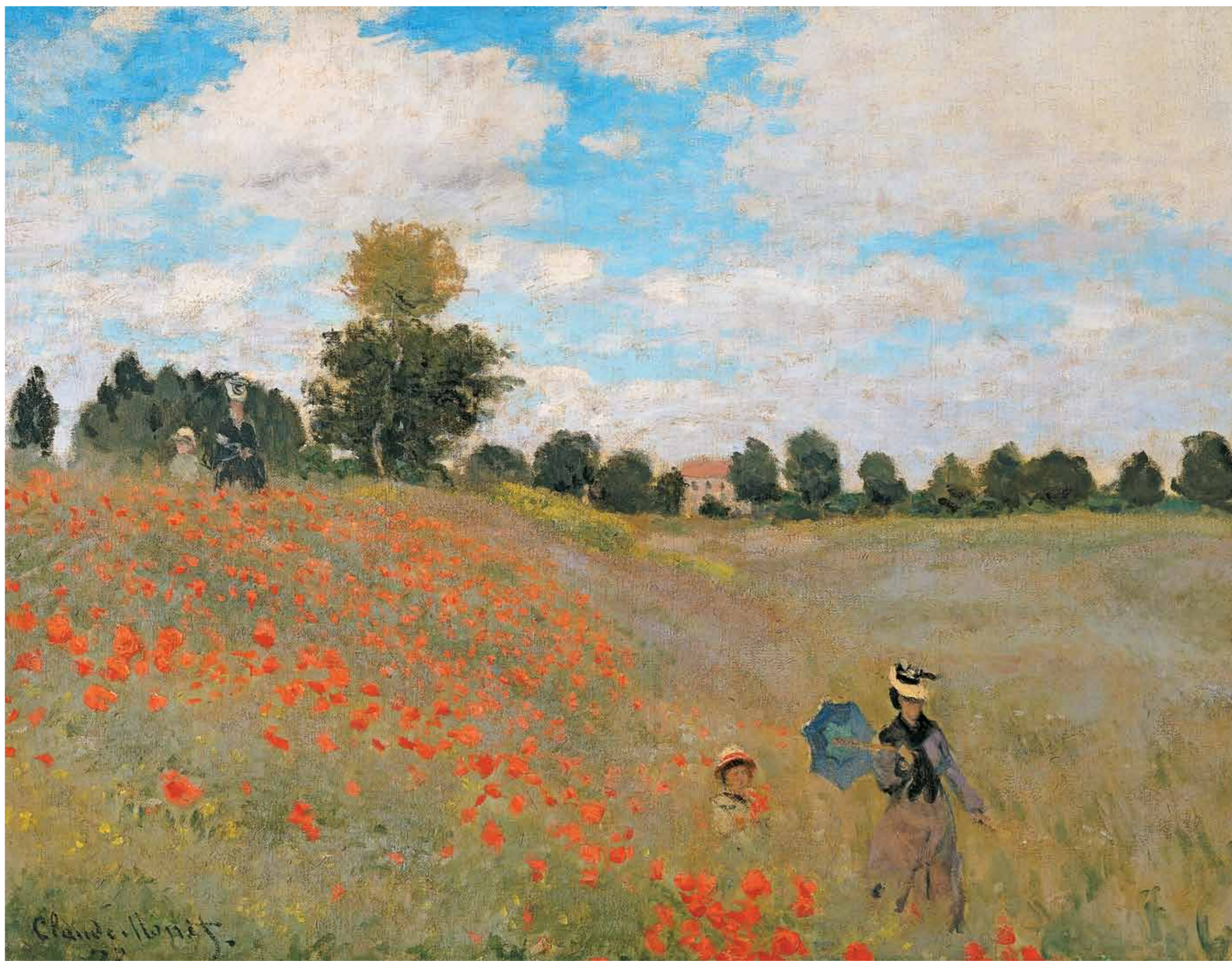
Wild Poppies, near Argenteuil. Claude Monet, 1873. Поле маков у Аржантёя. Клод Моне, 1873.