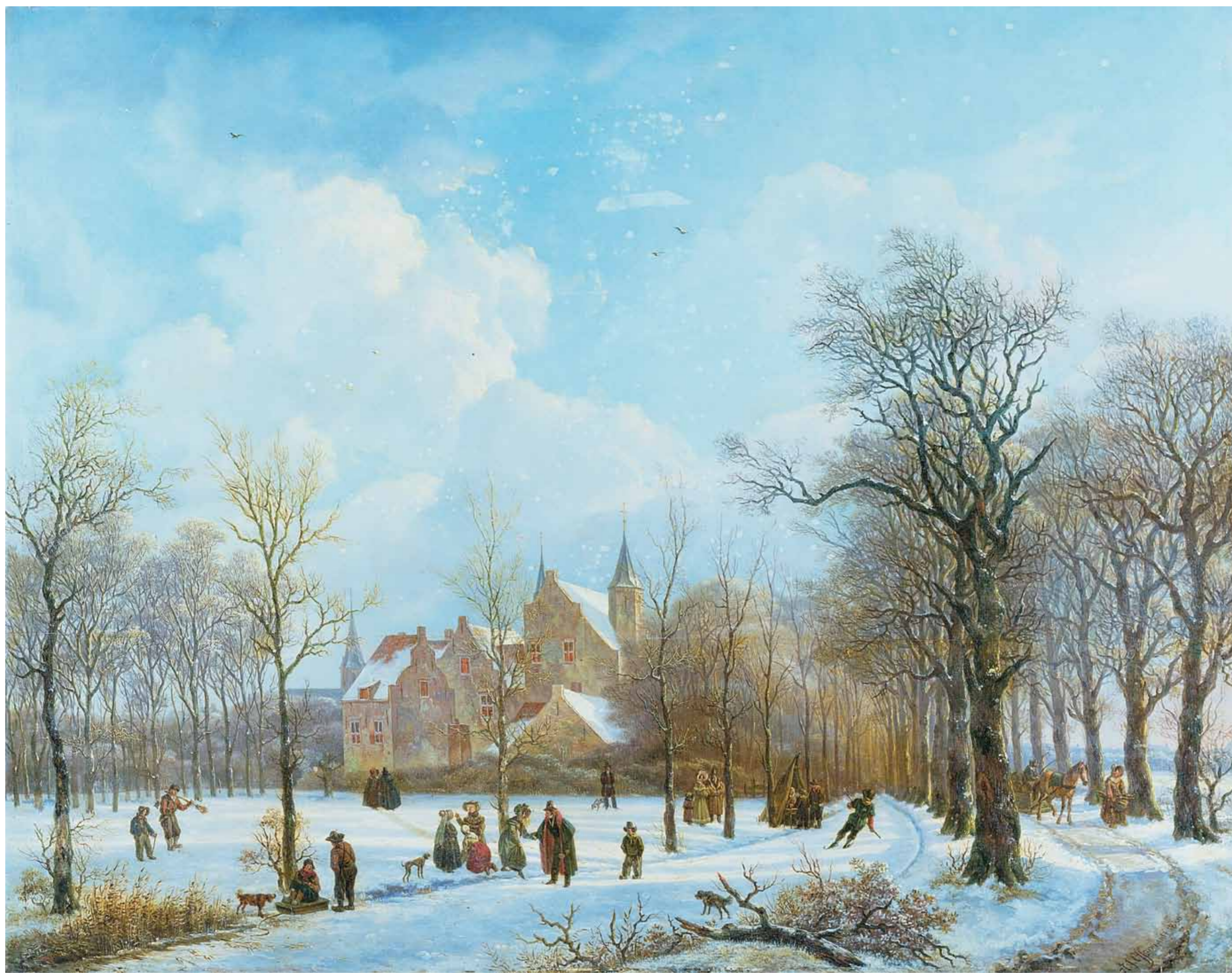
Skaters in a Winter Landscape. Anthony Jacob Offermans, 1830. Зимний пейзаж с конькобежцами. Энтони Джейкоб Офферманс, 1830.