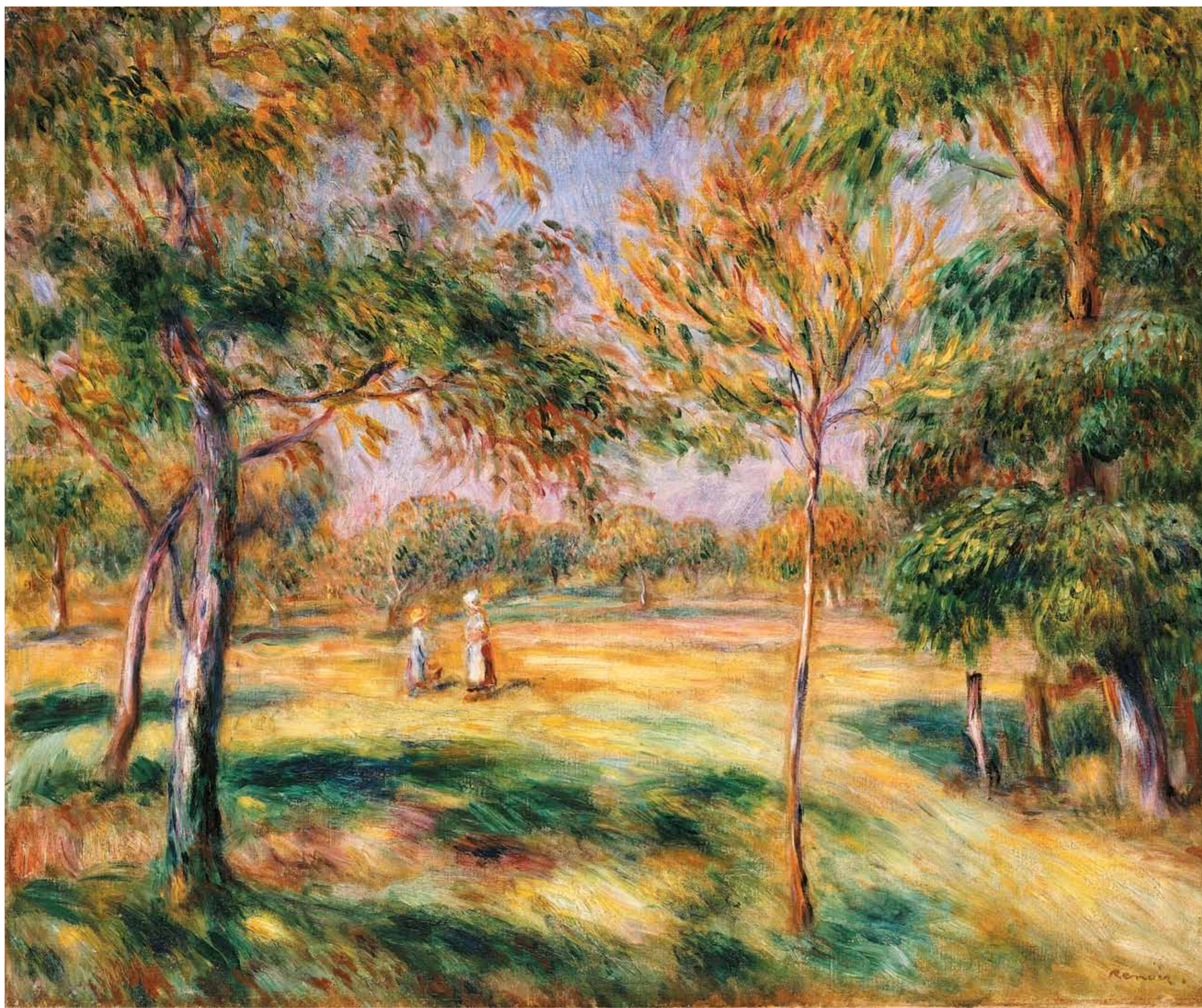
The Glade. Pierre Auguste Renoir, 1895. Поляна. Пьер Огюст Ренуар, 1895.