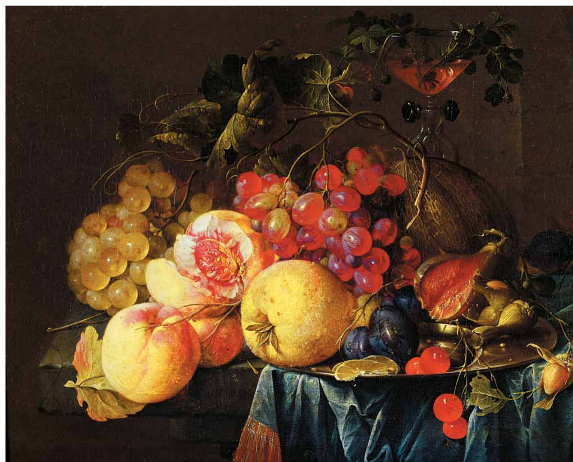
Still Life. Heem Cornelis de. Натюрморт. Корнелис де Хем.

«Чтобы сохранить лидерство на рынке, компания должна требовать от своих сотрудников неукоснительно жить тем, что утверждает и содержит в себе ее бренд», – советует гурю маркетинга Филип Котлер. Ярким подтверждением эффективности ежегодного календаря «Вентс» является тот факт, что 10 из 12 его страниц становятся настенными картинами (предварительно помещенными в багеты) в домах сотрудников и партнеров компании. Так высокие стандарты, исповедуемые мировым брендом, становятся жизненной философией всех, кто работает на его успех.