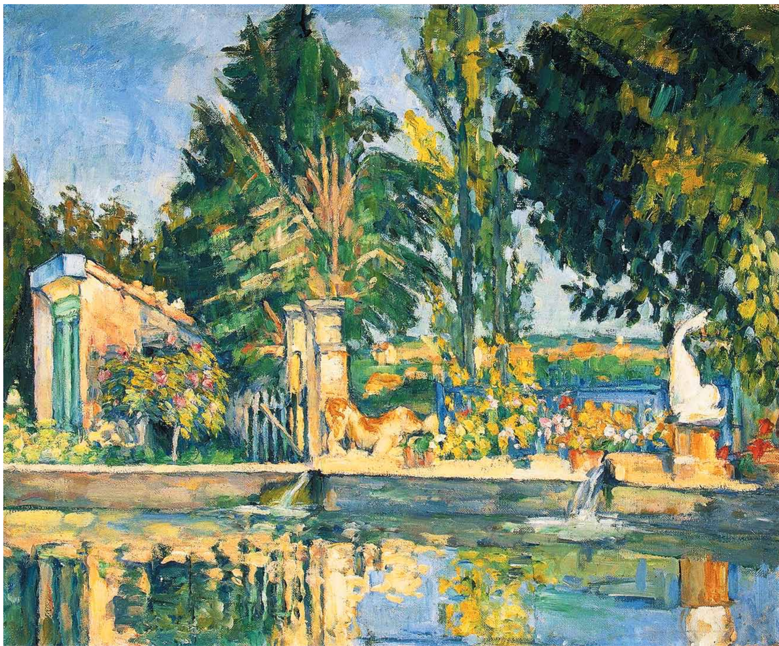
Jas de Bouffan, the pool. Paul Cezanne, 1876. Жа де Буффан, бассейн. Поль Сезанн, 1876.