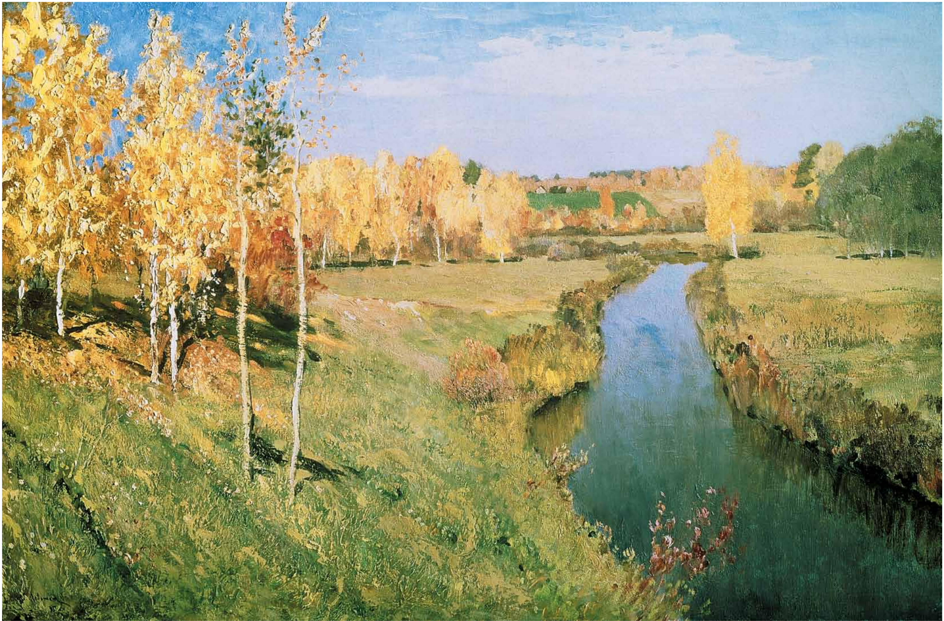
Golden Autumn. Isaak Ilyich Levitan, 1895. Золотая осень. Исаак Ильич Левитан, 1895.