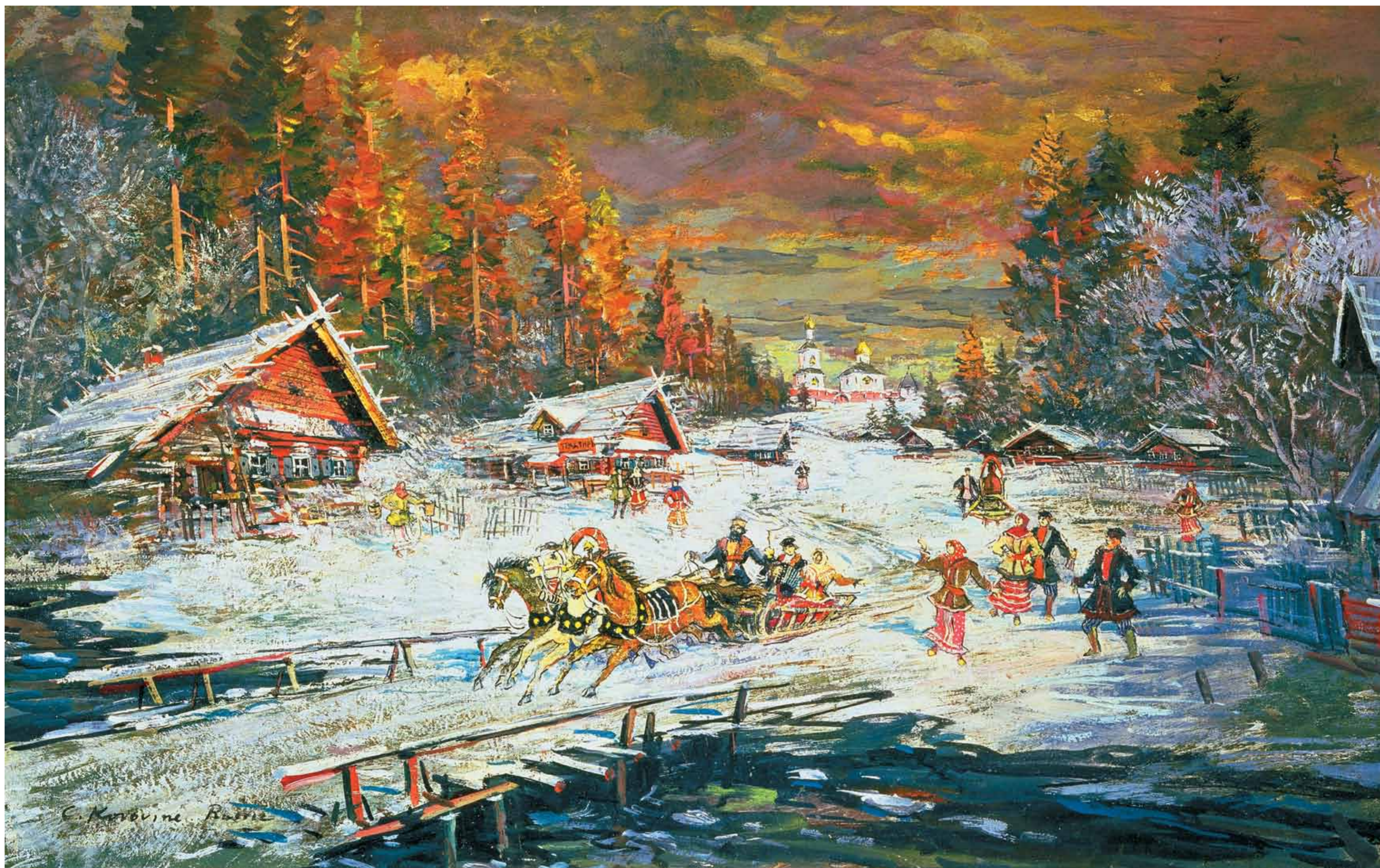
The Russian Winter. Korovin Konstantin Alekseevich, 1900-1910. Русская зима. Коровин Константин Алексеевич, 1900-1910.