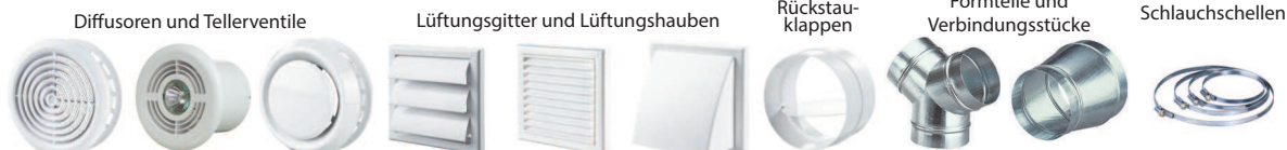
Diffusoren und Tellerventile