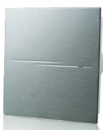
Квайт-Стайл А (с декоративной накладкой из алюминия)